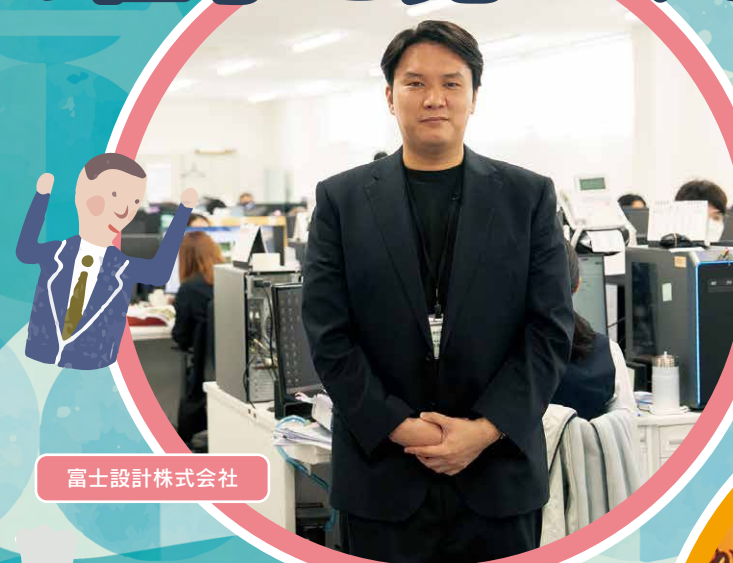
富士設計株式会社