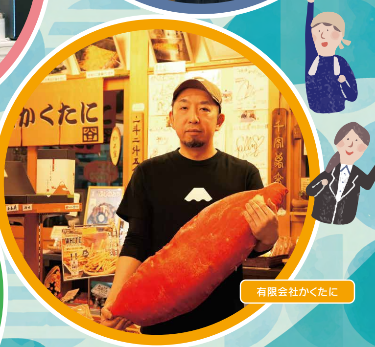
有限会社かくたに