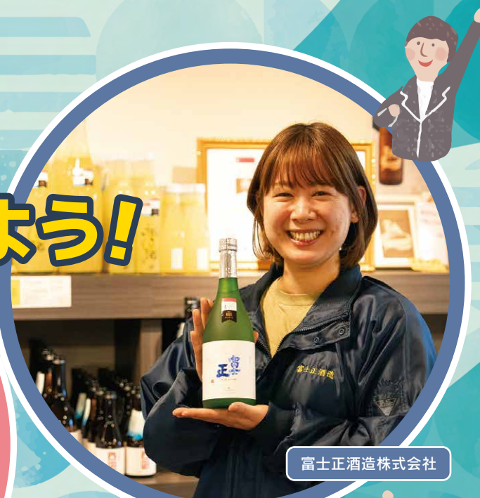
富士正酒造株式会社