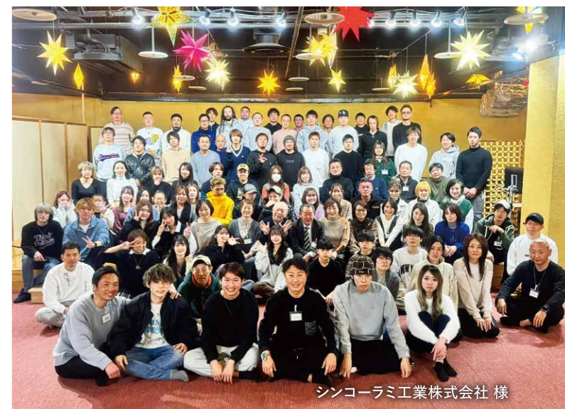
シンコーラミ工業株式会社 様