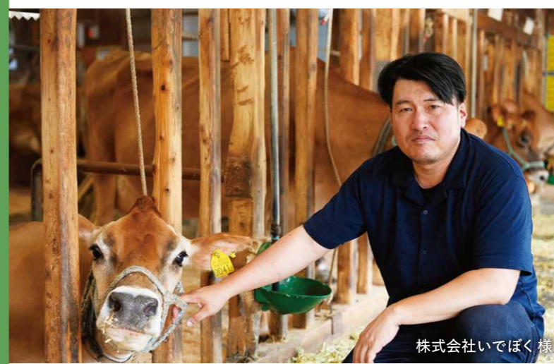
株式会社いでぼく 様