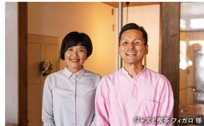
ジャズと喫茶 フィガロ 様